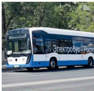
Новый экологический транспорт