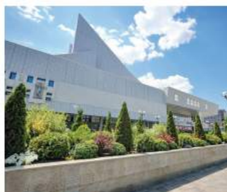
Ростов стал более благоустроенным