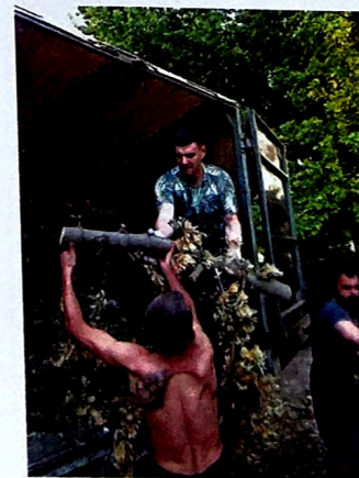
Активная помощь округу

Наша с Вами задача поставить всех начальников под строгий контроль. И вместе мы сможем решать все накопленные городские проблемы. У нас должен быть общественный контроль власти.