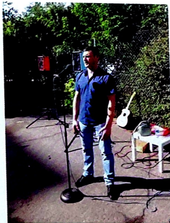
Проведение дворовых праздников