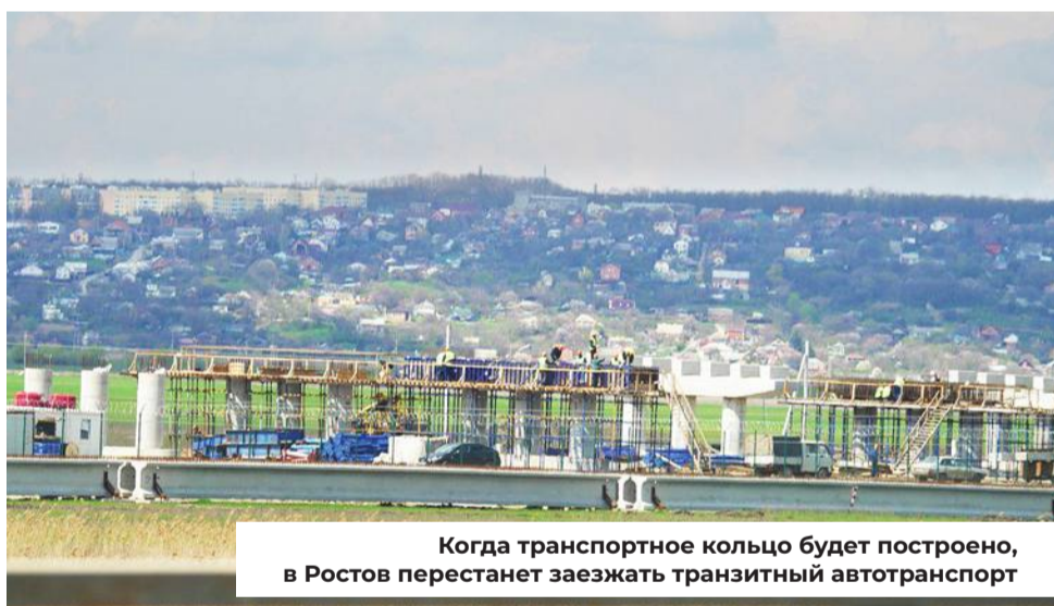
Когда транспортное кольцо будет построено, в Ростов перестанет заезжать транзитный автотранспорт