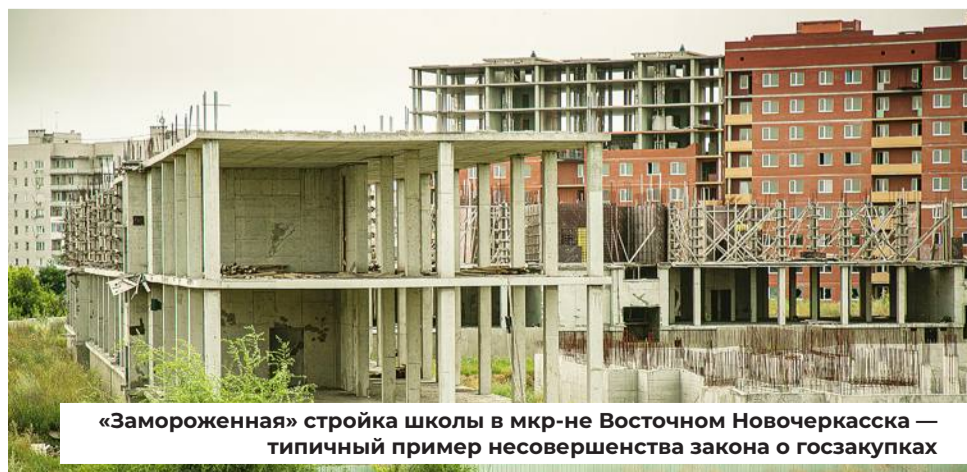
«Замороженная» стройка школы в мкр-не Восточном Новочеркаска — типичный пример несовершенства закона о госзакупках