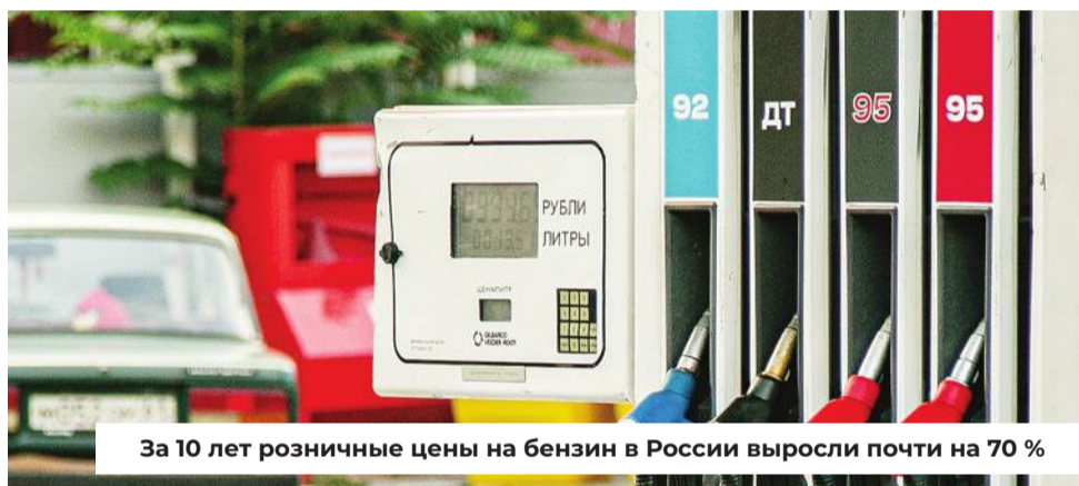
За 10 лет розничные цены на бензин в России выросли почти на 70 %

Цифры, которые каждый из нас видит на полках магазинов, — основной фактор, влияющий на благополучие россиян. А значит регулирование цен — одна из важнейших задач федеральной власти. Депутат Госдумы обязан включиться в эту работу, и я к ней готов!