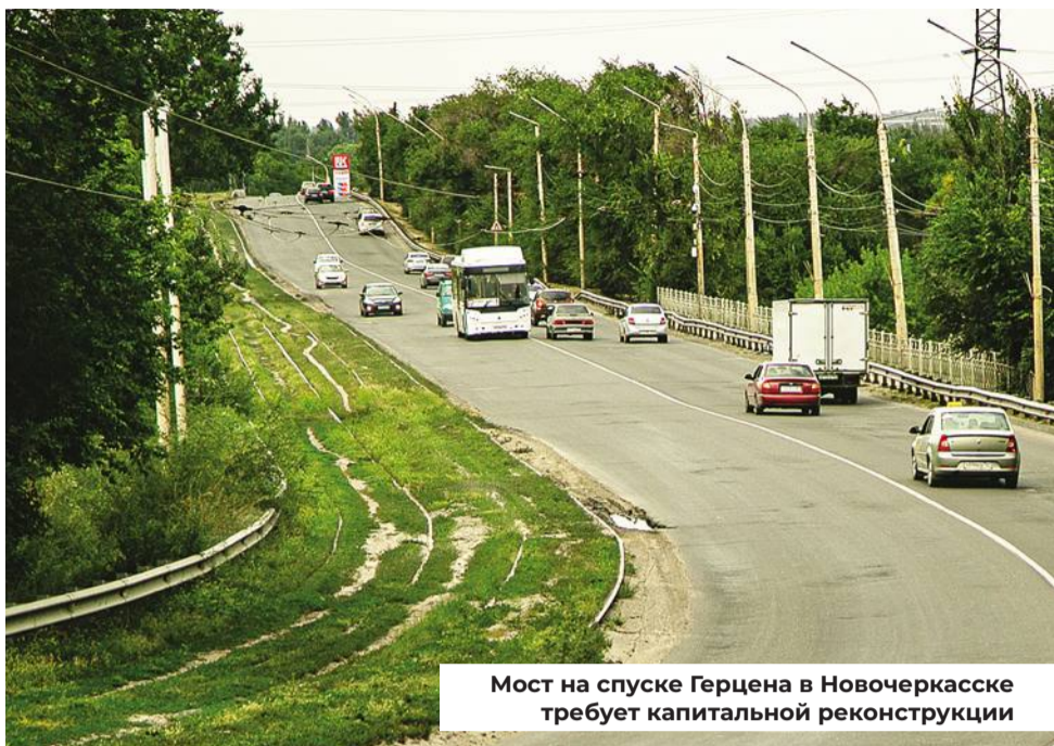
Мост на спуске Герцена в Новочеркасске требует капитальной реконструкции