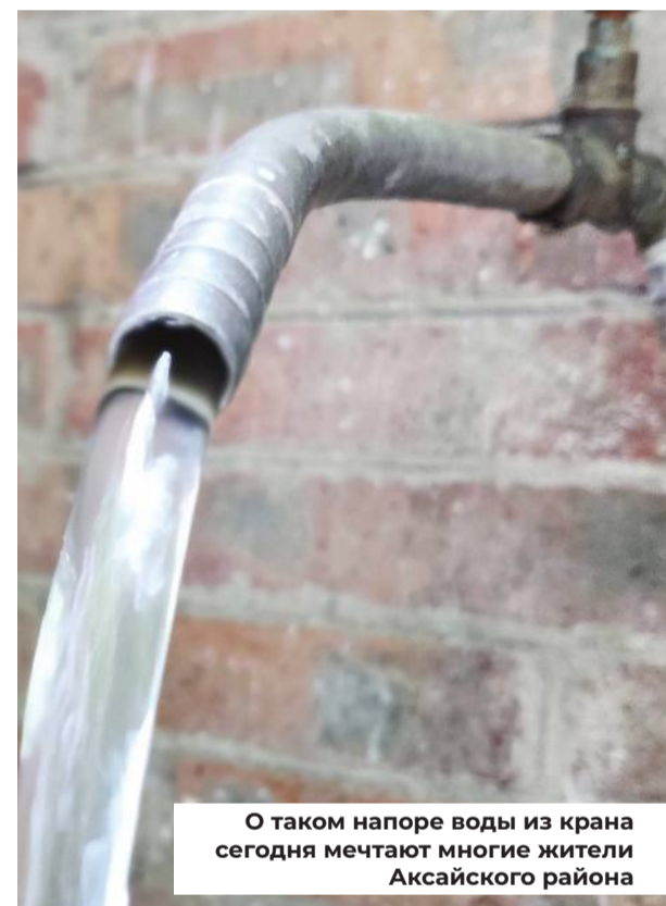
О таком напоре воды из крана сегодня мечтают многие жители Аксайского района

здесь большие. Молодежь охотнее будет оставаться на селе, если у нее будет возможность быстро добраться в город. Кроме того, от состояния дорог зависит, как быстро доедет скорая помощь, пожарные. В сельской местности необходимо запустить программу асфальтирования грунтовых дорог.