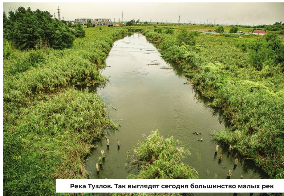
Река Тузлов. Так выглядят сегодня большинство малых рек

В связи с этим голоса в поддержку донских рек — ключевая задача депутатов Госдумы. Только они смогут добиться разработки конкретного проекта оздоровления Дона и его реализации.