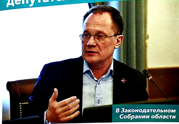
В Законодательном Собрании области