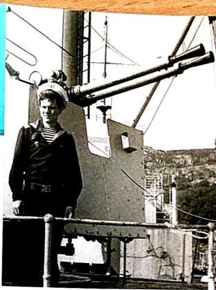
Присягу принял в Лиинахамари. Северный морской флот.

медицинском университете. Женат, двое взрослых детей. Более 25 лет занимаюсь общественной и политической деятельностью.