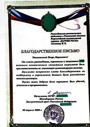
Благодарность за помощь от начальника госпиталя и заместителя Министра обороны, Председателя Государственного фонда «Защитники Отечества»

Став депутатом, я намерен добиваться улучшения нашего здравоохранения, которое должно стать доступнее и эффективнее для всех жителей города. У меня есть программа «Азовское долголетие», направленная на комплексное оздоровление азовчан.