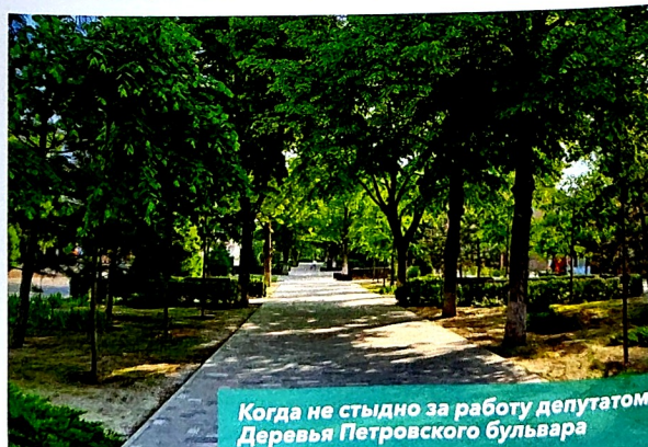
Когда не стыдно за работу депутатом. Деревья Петровского бульвара

В начале СВО по просьбе начальника военного госпиталя в палаты для раненых бойцов закупили кондиционеры на