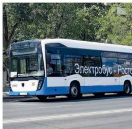
Новый экологический транспорт