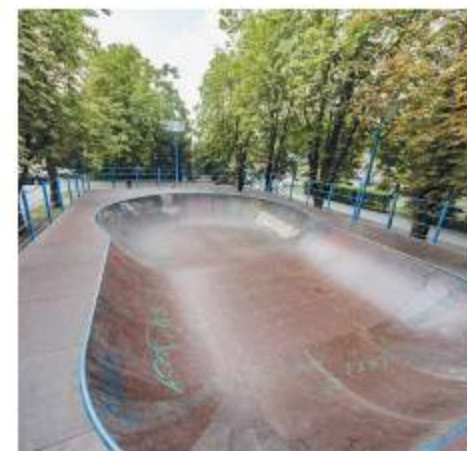
6 новых скейт-площадок появилось в разных районах города

■ Футбольные стадионы «Дон» на Гребном канале и «Арсенал» в Советском районе модернизированы.