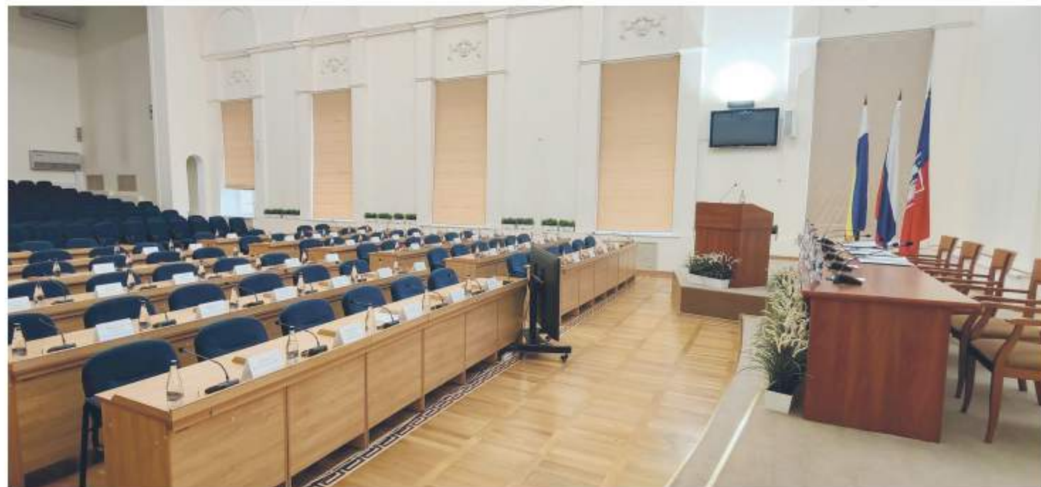
В зале заседаний городской Думы за пять лет приняты все важные решения для Ростова

□ Нравнодушные ростовчане получили возможность реализовать свои идеи по изменению облика Ростова за счет принятого Думой «Положения об инициативных проектах на территории города». За счет бюджета можно устанавливать новые детские площадки, уличное освещение, малые архитектурные формы и решать другие вопросы местного значения.