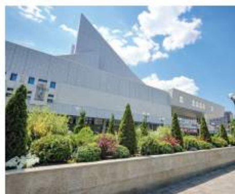
Ростов стал более благоустроенным