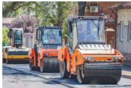
Асфальтирование дорог Ростова