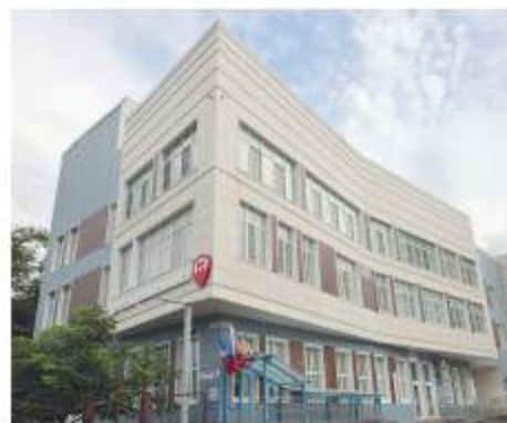
Новая детская поликлиника на Профсоюзной

■ 8 инфекционных госпиталей, 3 провизорных отде-