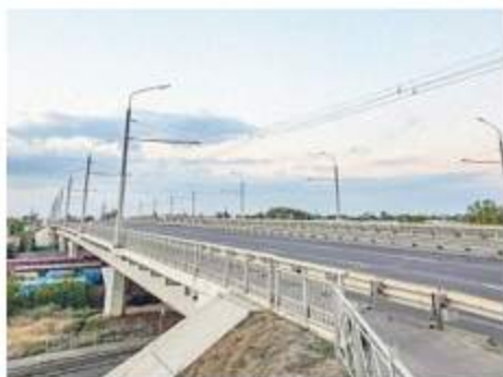
Мост на Малиновского