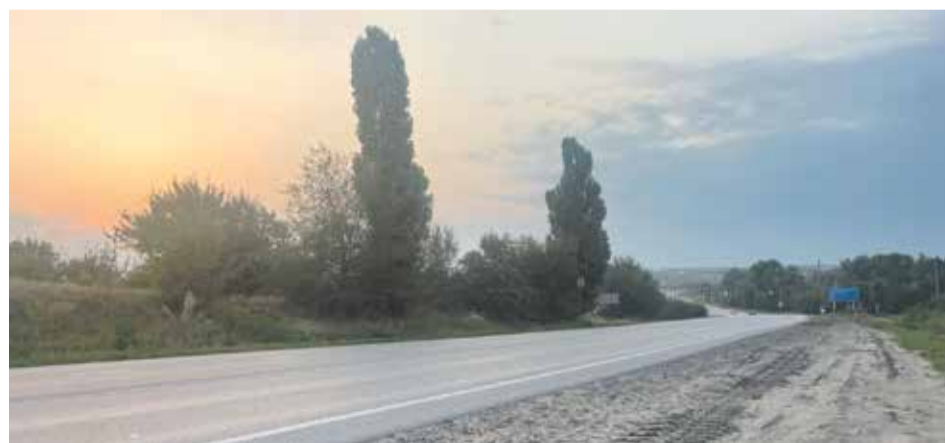
Дорога связывающая Новочеркасска и Каменоломни должна стать безопасной

Еще одна задача, требующая скорейшего решения – обеспечить жителям Новоперсиановки доступ к центральному водоснабжению. Отговорки, что водовод будет нерентабельным, неприемлемы. Жите-