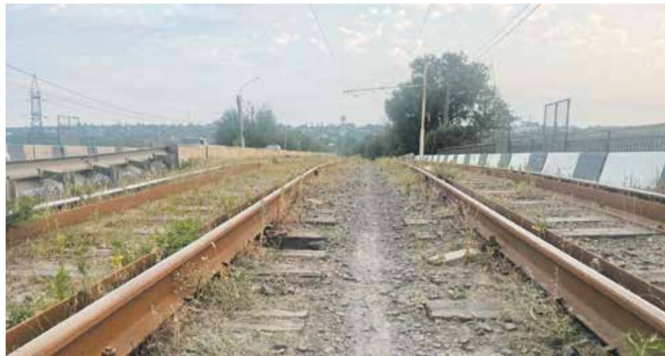
Скоростной трамвай – дешевый, экологичный и современный вид городского транспорта, который должен прийти на смену обычному трамваю

Кроме того, в Октябрьском поселке бывают перебои с подачей электричества. Данный вопрос нужно решать путем