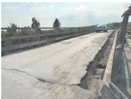
Мост в х. Яново-Грушевский отремонтируют уже в августе