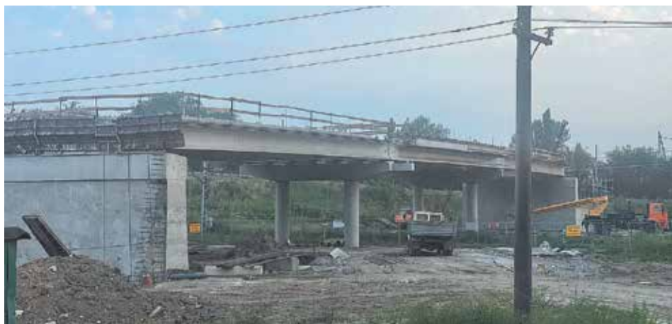
Путепровод на улице Машиностроителей – первая ласточка обновленной дорожно-транспортной инфраструктуры Новочеркаска