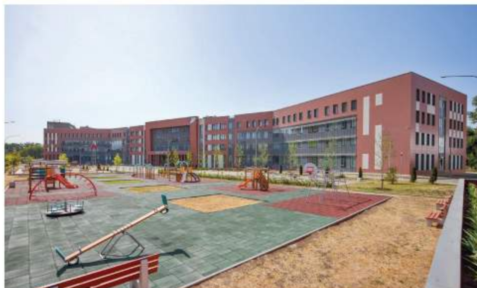
Новая школа в микрорайоне ЮФУ