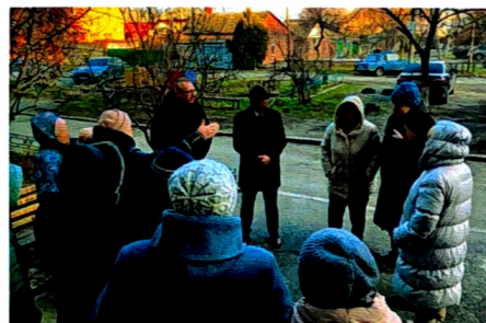
Обсуждение проблем с жителями дома по пер. Красноармейскому, 51/53 осенью 2023 г.

Вы успели оценить мою работу. Надеюсь, что вы и в этот раз окажете доверие и поддержите мою кандидатуру на выборах.