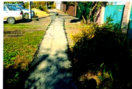
Асфальтирование тротуарных дорожек по ул. Октябрьской и ул. Дзержинского.