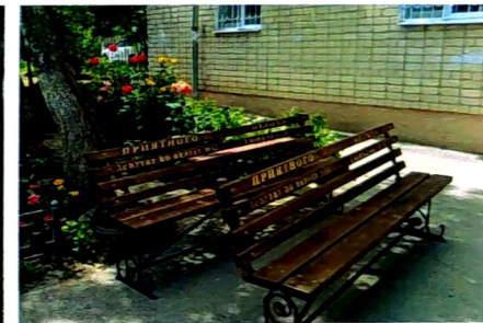
По просьбе жителей приобретены лавочки по пер. Красноармейскому, 51/53, ул. Московской, 61, 75/77.