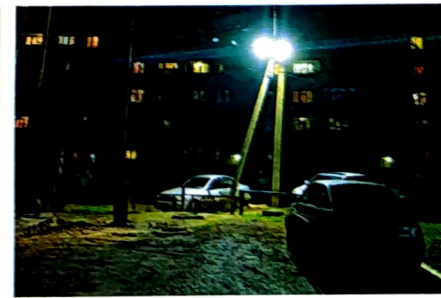
По просьбе жителей ул. К. Либкнехта приобретены и установлены два уличных фонаря.