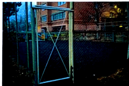
Произведен ремонт детской спортивной площадки во дворе МКД по ул. Московской, 92/100.