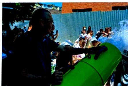
Один из праздников, посвященных Дню защиты детей, проходивший по адресу: ул. Московская, 61.