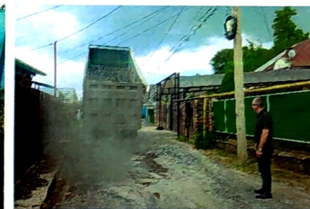
Один из примеров отсыпки дорожного полотна на ул. Береговой.