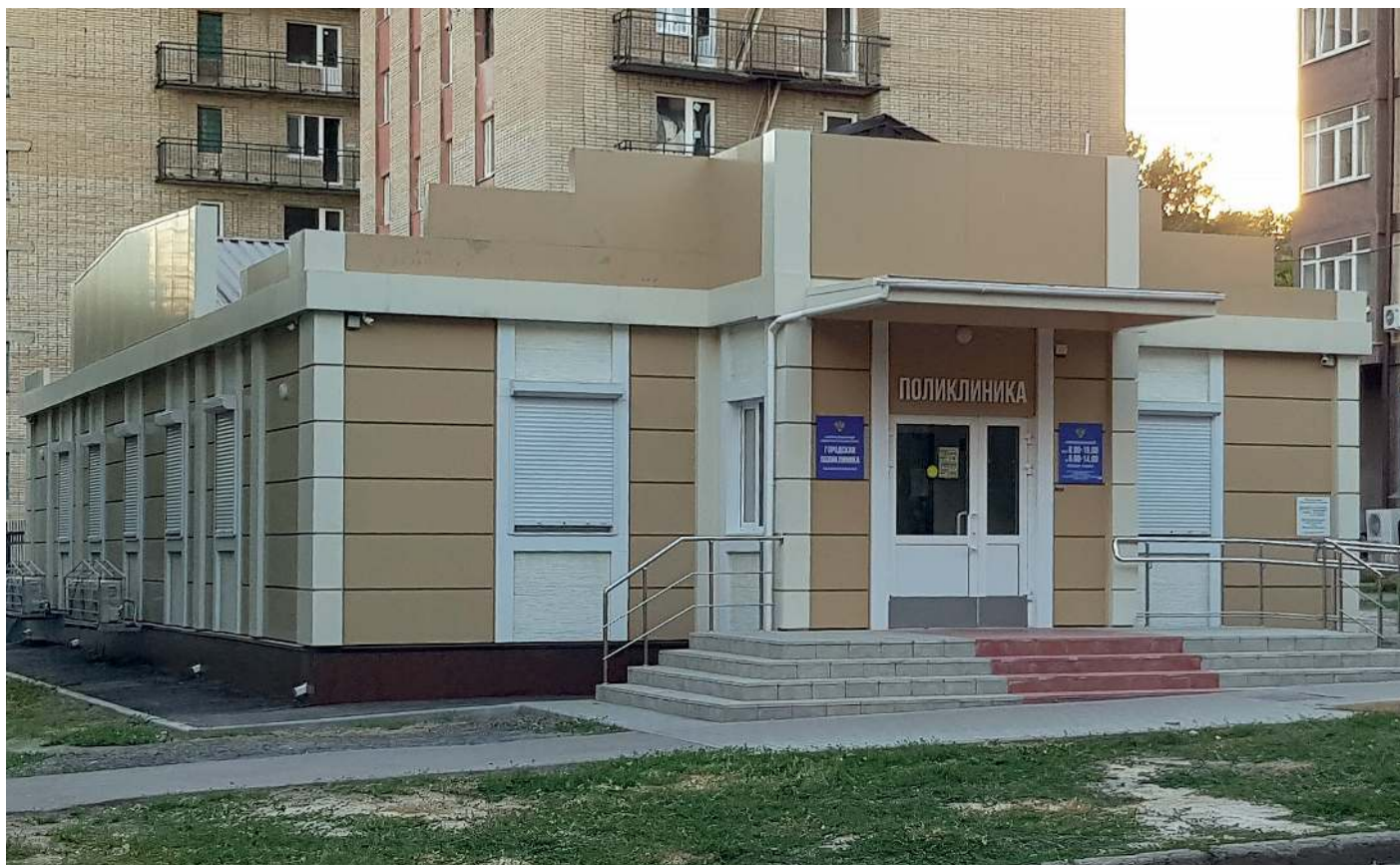
Городская поликлиника, поликлиническое отделение №4