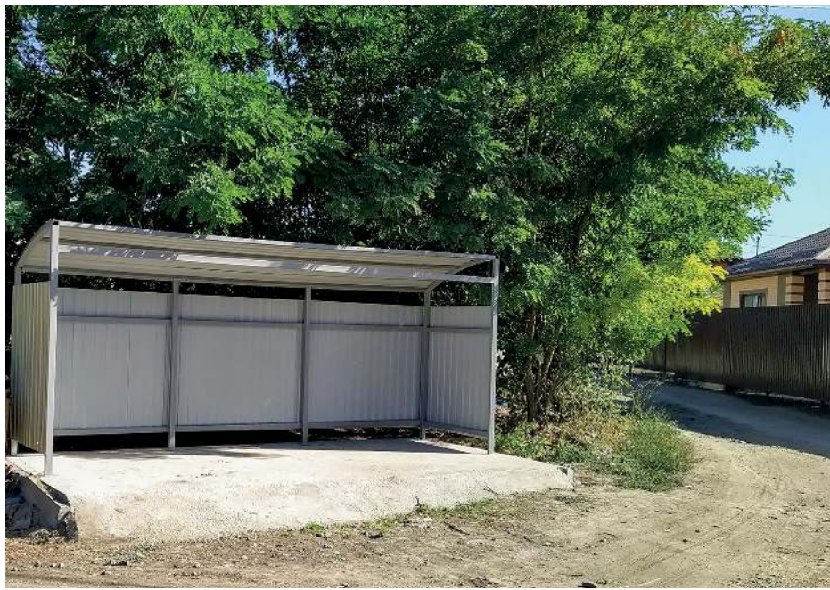
Переулоч Спасский, 6. Новая контейнерная площадка

Пять лет назад этот раздел моего отчета назывался «Вывоз мусора». Думаю, пришло время его переименовать и вот почему. За последнее время я получаю очень мало жалоб на несвоевременный вывоз мусора из контейнеров. Часть жалоб касается недостаточного количества контейнеров. Но всё это быстро решается буквально телефонным звонком. Проблема теперь больше с мусором вокруг контейнерной площадки. Депутаты неплохо поработали над Правилами Благоустройства города, у нас есть взаимодействие с региональным оператором по вывозу мусора. Как я и обещал, после преодоления ряда бюрократических проволочек, по специальной депутатской программе в городе началось строительство цивилизованных контейнерных площадок. Так, на нашем округе появились крытые контейнерные площадки по следующим адресам: угол Тургенева/Михайловской, угол Первомайской/Жлобы, угол Крупской/Бакунина, пер. Спасский, 6, две на Ключевом (Казачья, Центральная), в течение 2-3 недель будут достроены площадки на ул. Бакунина, 64, пер. Скрябина, 1.