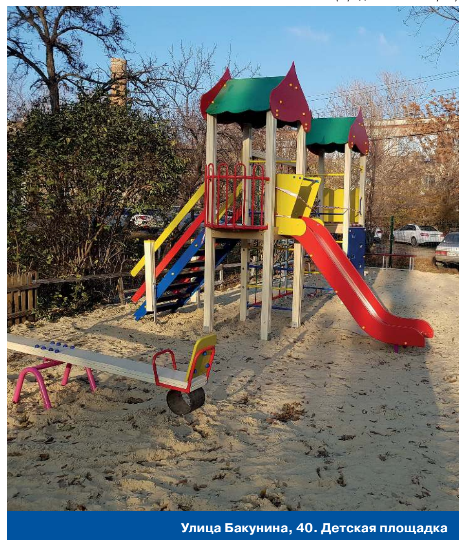
Улица Бакунина, 40. Детская площадка

10 лет назад у нас на округе не было ни одной новой площадки. С 2010 по 2015 год всё начало быстро меняться, мы стали устанавливать игровые комплексы практически возле каждого многоквартирного дома. Программа оказалась очень востребованной, и я получил новые заказы на 2015 - 2020 годы. В своей программе, с которой я шел на выборы в 2015 году, я обещал установить детские игровые комплек-