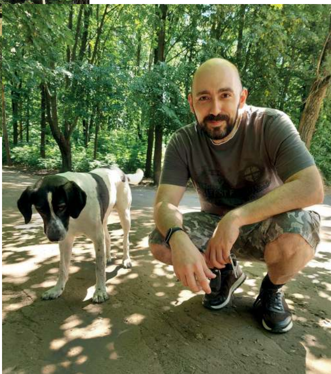
Сквер Ключевого. С местным любимцем

множественно. Я считаю, что мужчина должен уметь держать оружие в руках, да и для здоровья прогулки полезны.