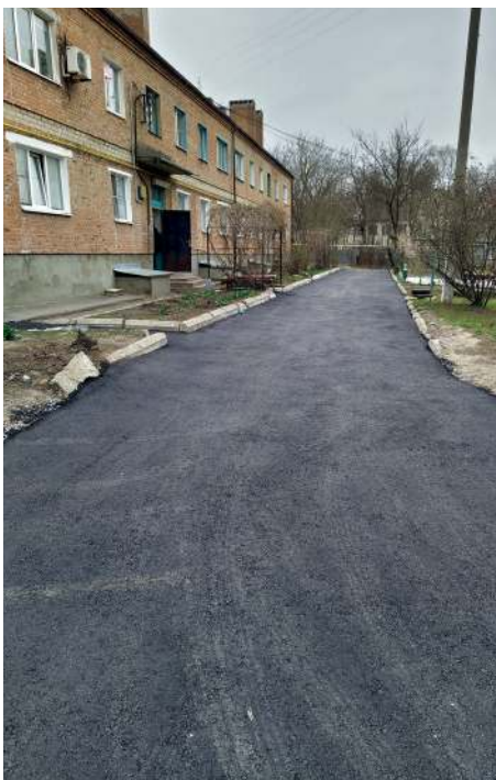
Улиц Казачья, 12. Внутридворовой ремонт

По запросу депутата были отремонтированы внутридворовые территории по следующим адресам: Троицкая, 79/112, Троицкая, 80А, Ангельса, 49, Ангельса, 49А, Просвещения, 155, Просвещения, 184, 184Б, Казачья, 12. Был повторно отремонтирован въезд во двор ул. Бакунина, 91 (А,Б,В) и тро-