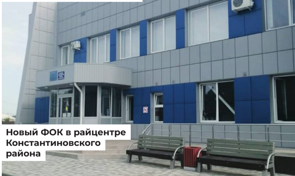
Новый ФОК в райцентре Константиновского района

Обеспечено финансирование строительства современных спортивных комплексов в Константиновске и Константиновском и Орловском районах.