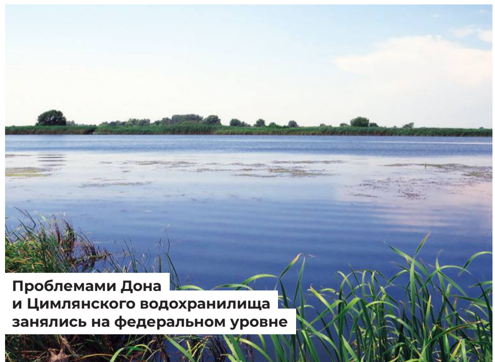
Проблемами Дона и Цимлянского водохранилища занялись на федеральном уровне