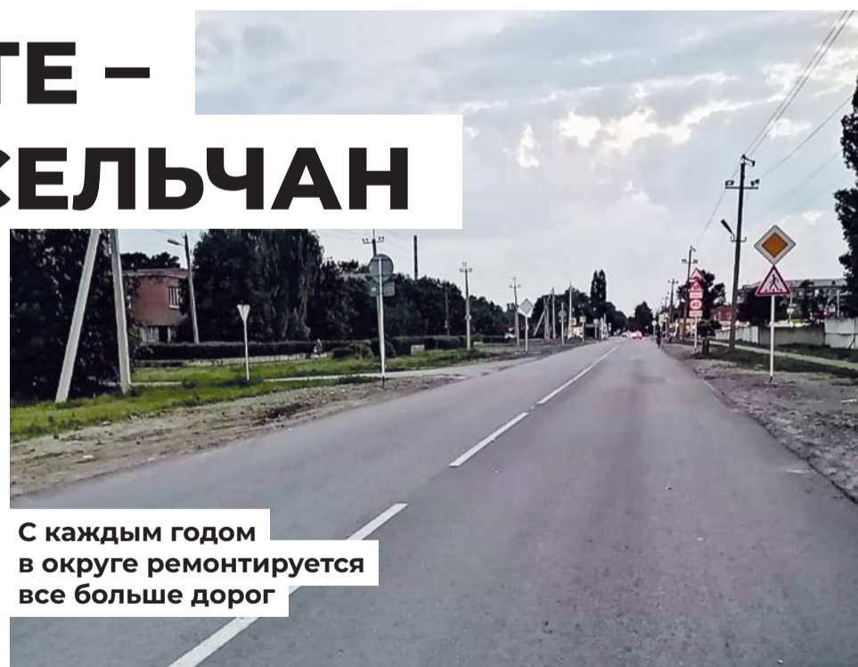
С каждым годом в округе ремонтируется все больше дорог

го округа выросло, в ряде из них – в 4 раза. Благодаря совместным усилиям всех ветвей и уровней власти активно реализуется проект «Безопасные дороги». В Семикаракорске заработал новый шестифракционный асфальтобетонный завод ГУП РО «Ростов-АвтоДор».