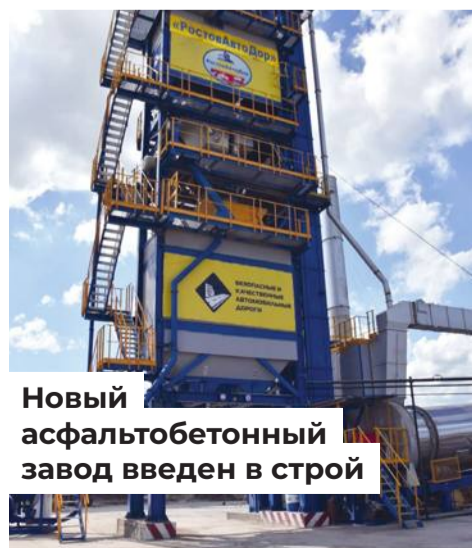
Новый асфальтобетонный завод введен в строй

Динамика есть, и она положительная. Ежегодное финансирование дорожной сферы во всех сельских районах избирательно-