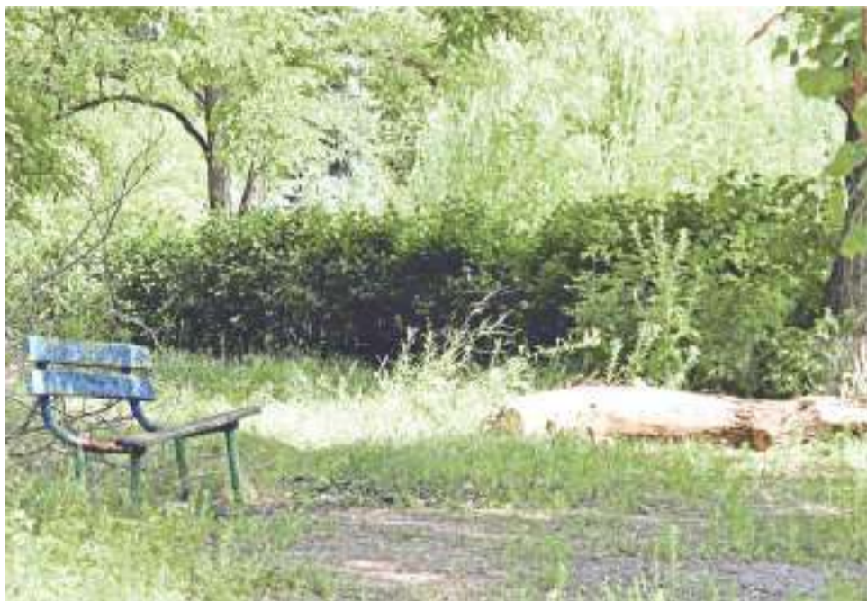
Благоустройство парка им. Романенко в Миллерово остановилось

Как известно, границы одномандатных избирательных округов на предстоящих выборах в Законодательное Собрание Ростовской области изменились. И если жителям Кашарского, Милютинского, Обливского, Советского районов я уже давно знаком, то с жителями Миллерово, которые теперь тоже войдут в состав округа, мы встречались реже.