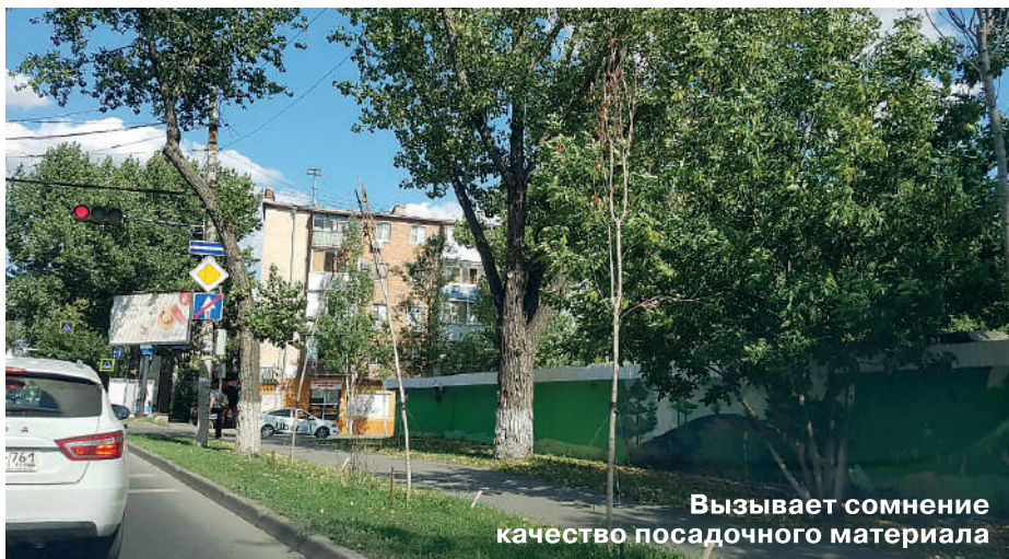
Вызывает сомнение качество посадочного материала