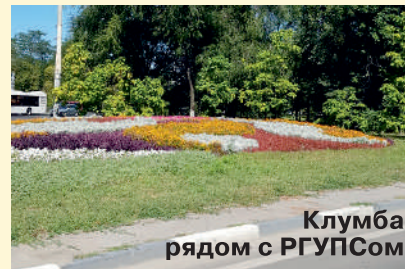
Клумба рядом с РГУПСом

? Есть вопросы к уборке района. Центральный проспект Ленина моют и убирают регулярно, стригут газоны и высаживают цветы. Такое рвение похвально. Но почему у нас забывают о дворах?