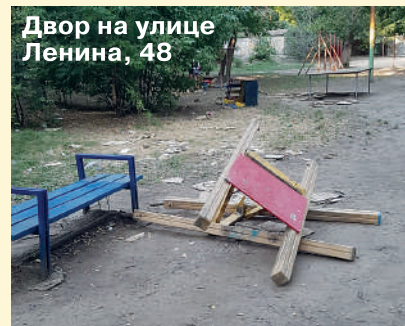
Двор на улице Ленина, 48