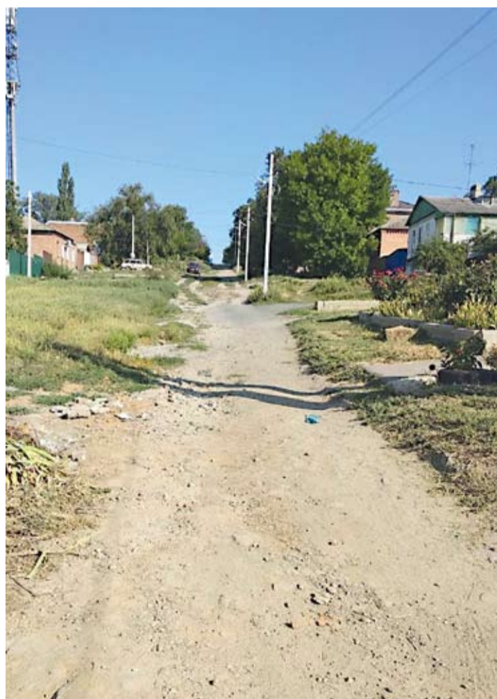
В так называемых «низовках» особенно остро стоит вопрос отсыпки и грейдирования многочисленных грунтовых дорог.