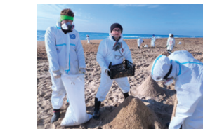
Участие в ликвидации последствий разлива мазута в Анапе