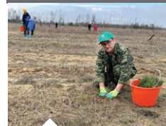
Высадка саженцев сосны в Лесхозе