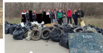
Каждую весну и осень проводим с командой субботники