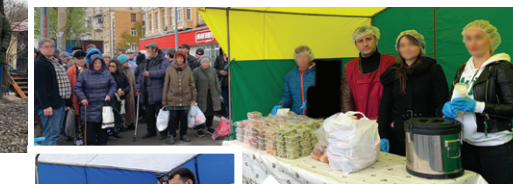
Участие в благотворительных акциях — предоставление питания малообеспеченным, нуждающимся людям нашего города