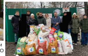
Систематическое оказание помощи приютам для животных