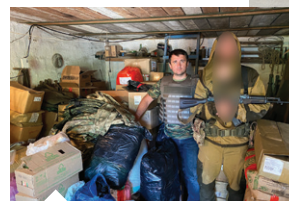
Передача гуманитарной помощи и снаряжения бойцам в зоне СВО