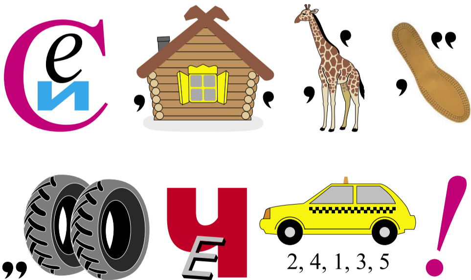
Ответ: Все на избирательные участки!