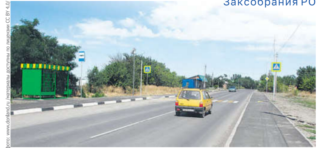
фото: www.donland.ru / Материалы доступны по лицензии СС BY 4.0/