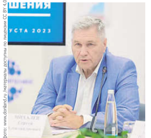
фото: www.donland.ru / Материалы доступны по лицензии СС BY 4.0/

всем такая задача под силу. Необходимо включить в эту работу региональные центры «Мой бизнес», расширить сеть центров, представлять помощь в подготовке бизнес-планов удаленно, в формате онлайн.