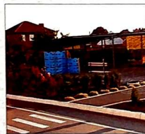
Игровые площадки д/с № 37. Вот в таких прекрасных условиях играют дети нашего округа.