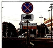
Установлен запрещающий знак. Жители дома пр. Литейный, 1 «А» вздохнули свободно.