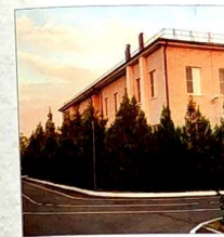
Строительство детского сада в поселке Солнечный было одним из главных наказы депутату жителей округа № 1. А раньше здесь был пустырь. С этим объектом в поселке появилась асфальтированная дорога, современное освещение.