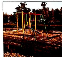
Одна из многих детских площадок, установленных Юрием Голованевым в округе № 1.