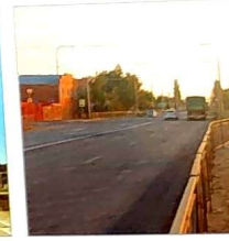
Реконструкция Кагальницкого шоссе всем нам далься с «Бойм». Сколь угодно написано обращений, запросов, поездок в Ростов, приездов в округ больших руководителей по инициативе депутата для встречи с жителями. Итог – реконструкция шоссе проведена.