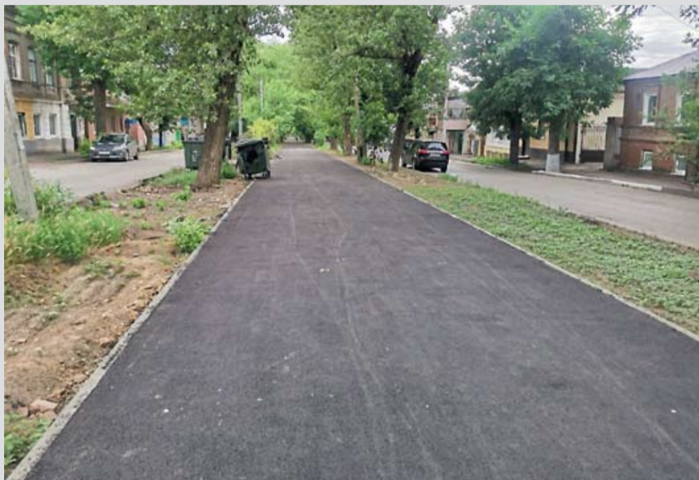
Усилиями депутата на аллее на ул. Комитетской был полностью обновлен разбитый асфальт и установлены поребрики. В ближайшее время здесь также появятся новые лавочки и будут опилены деревья.

Восстановление асфальтобетонного покрытия по ул. Комитетской в районе домов № 198, 196.