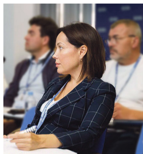
Задача проекта — сформировать комплексное видение развития социальной сферы.

«Сейчас важно транслировать опыт Ростовской области, да и других регионов, для управ-