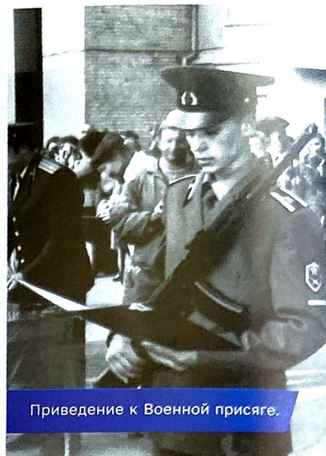
Приведение к Военной присяге.

1998 году занимал должность старшего офицера первого отделения в Шахтинском военном комиссариате.